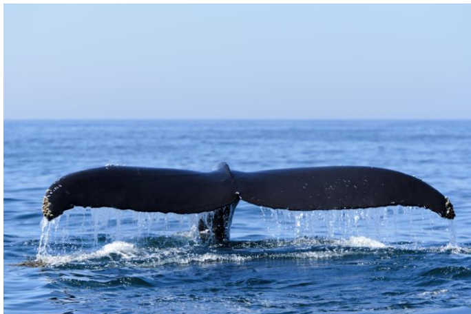
Whale Watching in Nova Scotia

Die Provinz Nova Scotia liegt an der Ostküste Kanadas und besteht im Wesentlichen aus einer Halbinsel im Atlantischen Ozean und Cape Breton Island, nordöstlich des Festlandes. Unzählige Buchten und Fischerorte säumen die Küste. Nova Scotia ist flächenmäßig die zweitkleinste Provinz Kanadas und kein Ort ist mehr als 56 km vom Meer entfernt. Mit knapp unter 1 Million Einwohner, 11 Universitäten und über 60 High Schools hat die Provinz die höchste Dichte an Bildungseinrichtungen in Kanada. Das milde Klima macht die Provinz zu einem perfekten Ort für Austauschschüler. Die zwei Nationalparks der Provinz sind der Cape Breton Highlands-Nationalpark im Norden und der Kejimikujik Nationalpark im Süden.